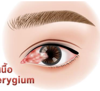
ต้อเนื้อ Pterygium

เป็นโรคตาที่พบได้บ่อย เป็นเนื้องอกชนิดไม่ร้ายแรงของเยื่อบุตา มีลักษณะเป็นแผ่นเนื้อสีแดงรูปสามเหลี่ยม งอกจากเยื่อบุตา ลามเข้าไปบนกระจกตา มักพบบริเวณหัวตามากกว่าหางตา หรือในบางครั้งพบพร้อมกันทั้งหัวตาและหางตา ต้อเนื้อจะโตขึ้นอย่างช้าๆ ในกรณีที่เป็นมากอาจลามเข้าบังกลางกระจกตา ปิดบังการมองเห็นบางส่วน ทำให้เกิดอาการตามัว อาจเกิดสายตาสั้นจากการดึงรั้งของต้อเนื้อที่กระจกตา บางรายอาจเห็นภาพซ้อนได้