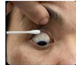
ขณะเช็ดขอบตาบน ให้ผู้ป่วยมองลงต่ำ