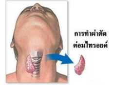
การทำผ่าตัดต่อมไทรอยด์